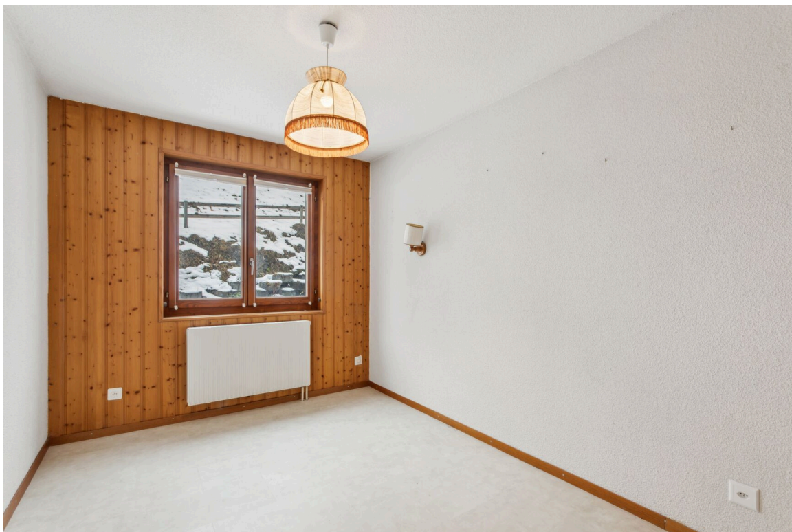
Chambre no 3