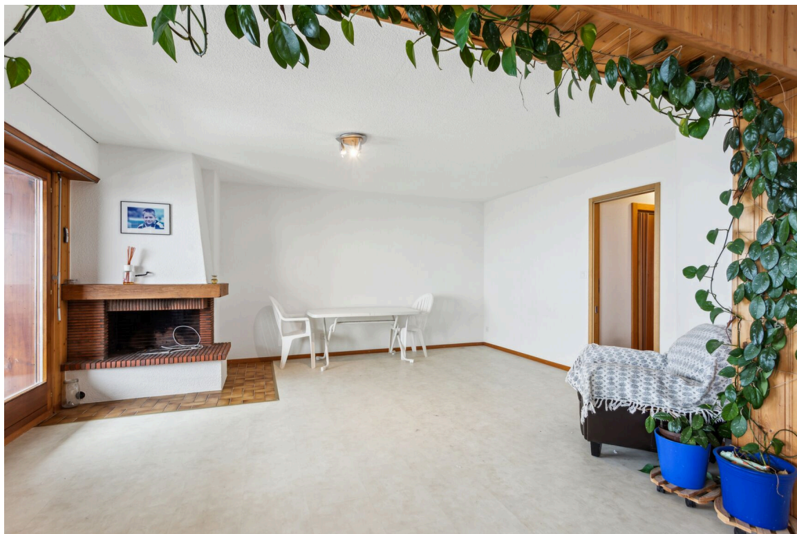
Pièce à vivre