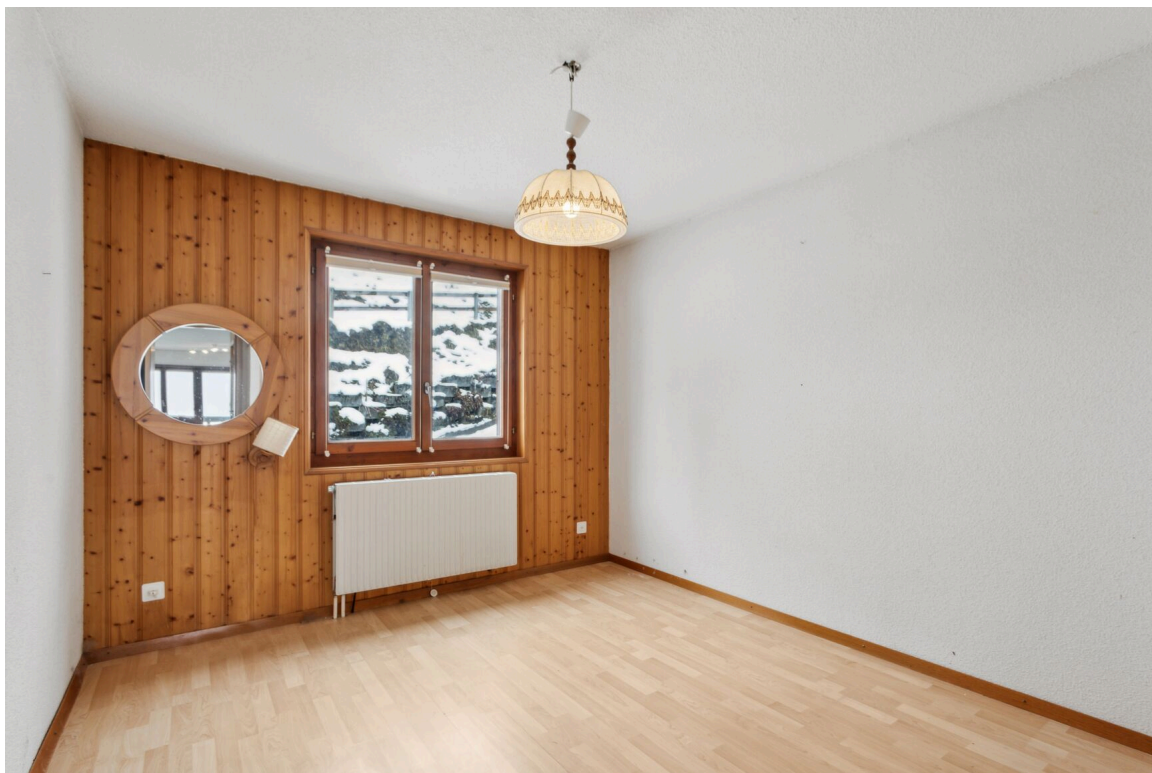
Chambre no 2