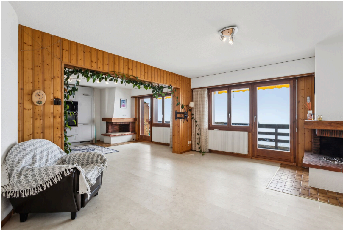
Pièce à vivre