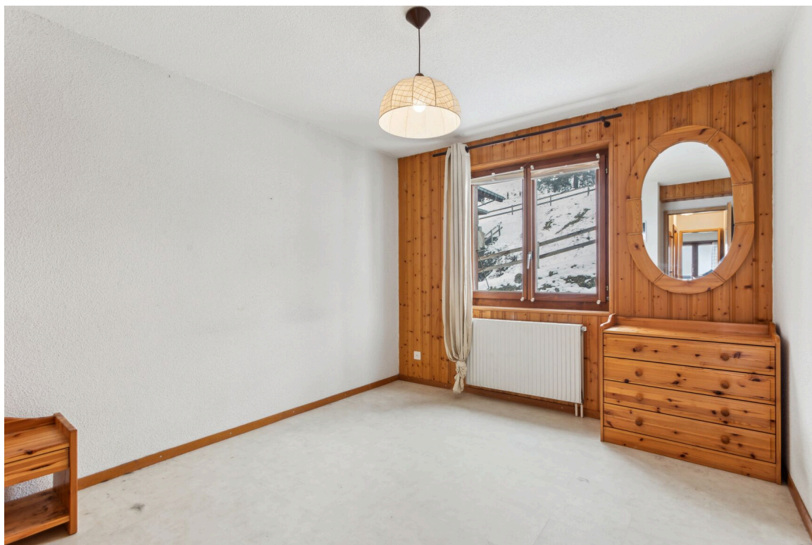
Chambre no 1