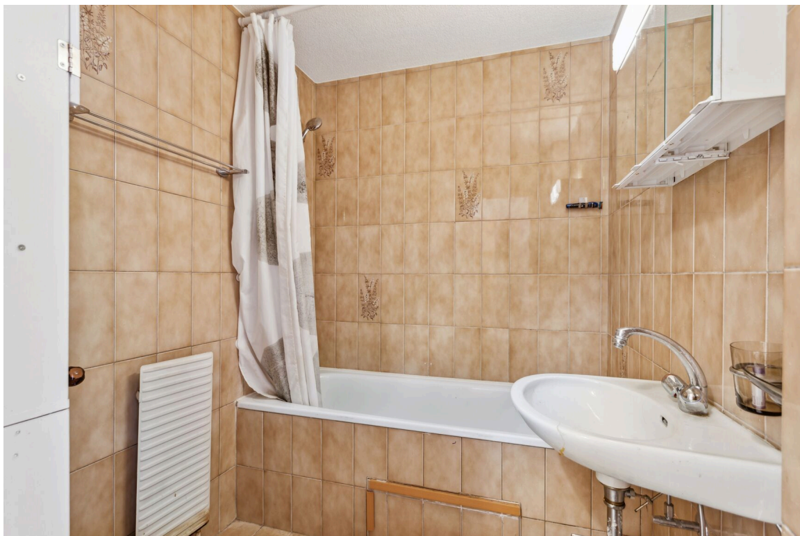
Salle d'eau no 2