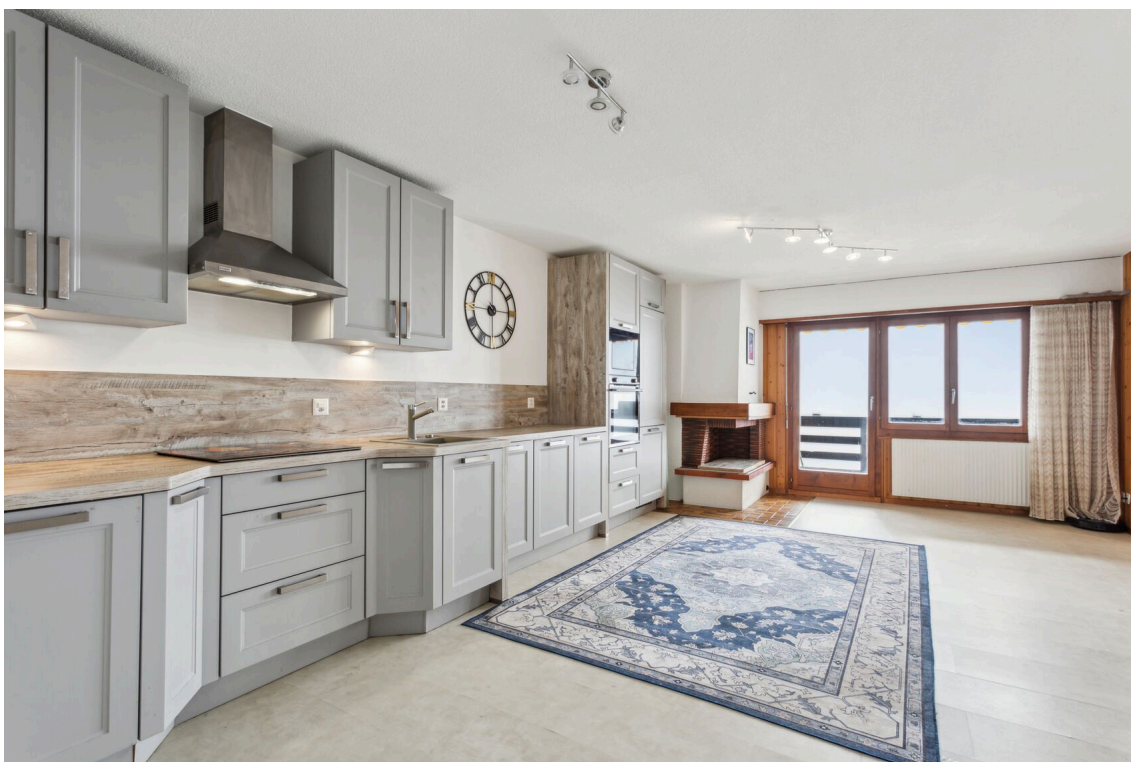
Cuisine agencée ouverte