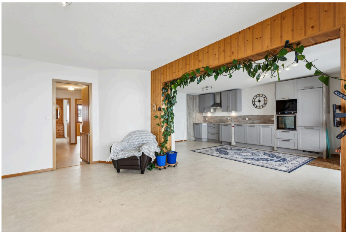
Pièce à vivre