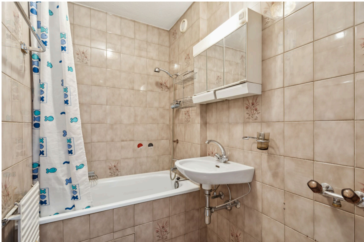
Salle d'eau no 1 avec pré-équipement pour une machine à laver