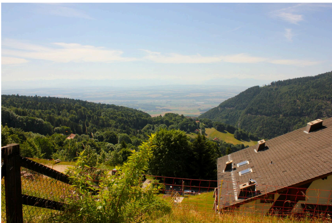
Magnifique vue depuis le bâtiment Andromède