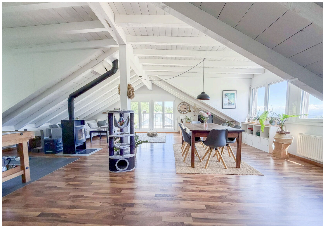
Grand séjour ouvert