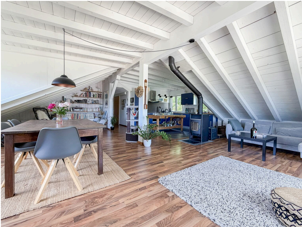
Grand séjour ouvert