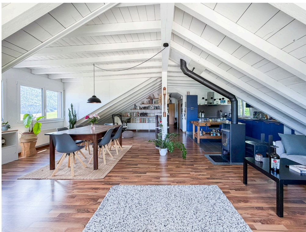
Grand séjour ouvert