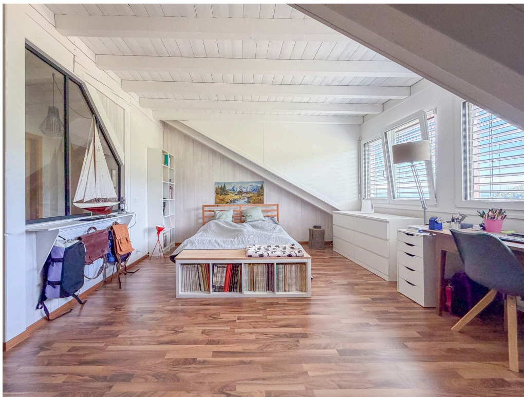
Chambre avec une verrière