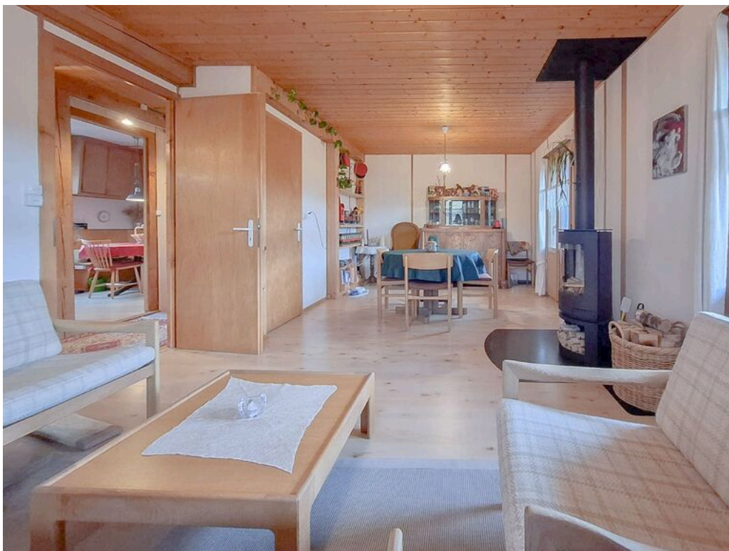
Rez supérieur - séjour ouvert sur la salle à manger