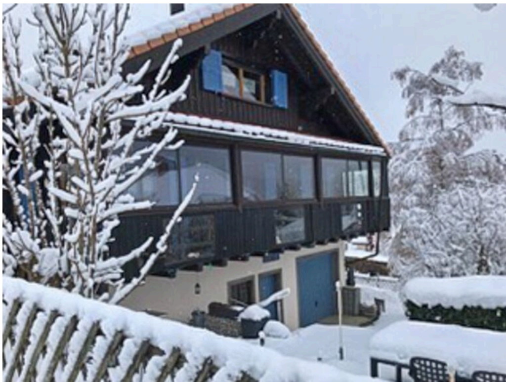
Vue hivernale sur le chalet