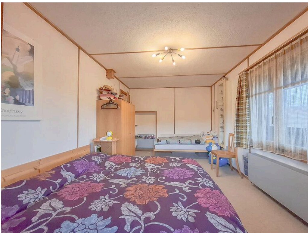
Rez supérieur - chambre 1 avec accès à la véranda