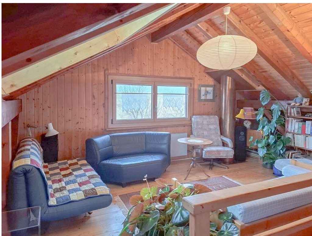
1er étage - spacieuse pièce mansardée avec velux