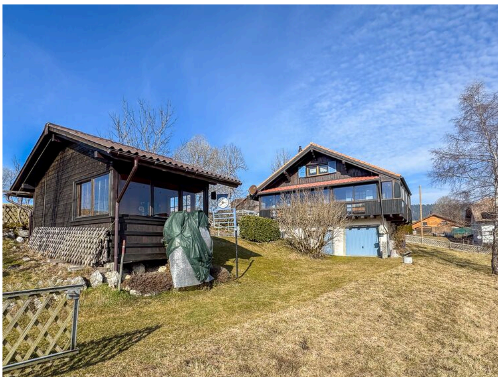
Vue sur le chalet et le pavillon de jardin