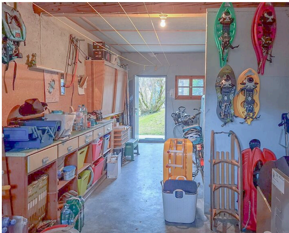
Local technique avec espace de rangement