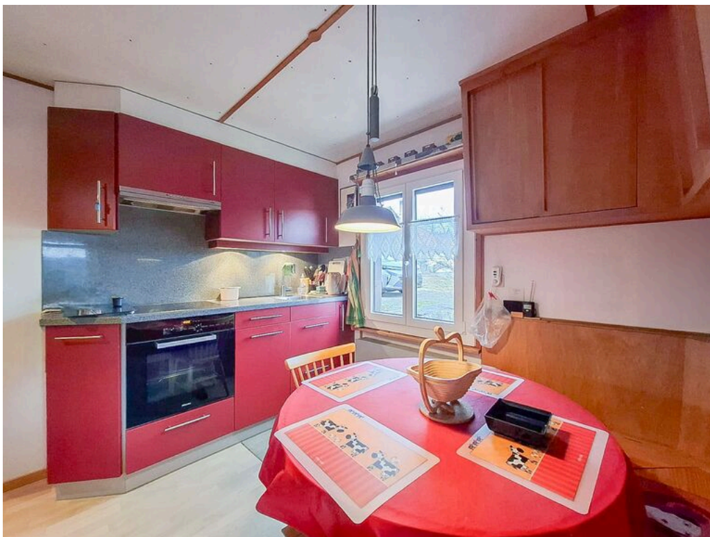
Rez supérieur - cuisine agencée fermée