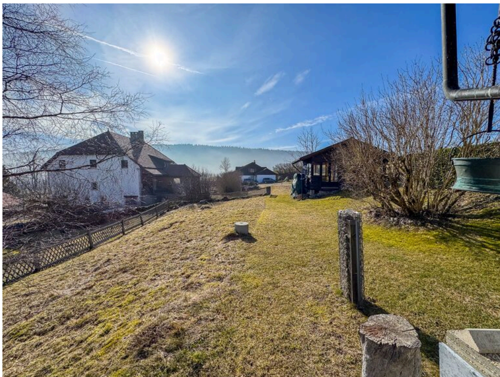
Vue sur le jardin