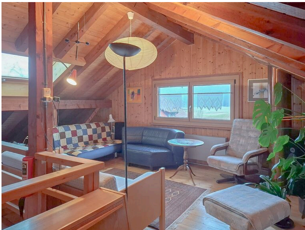
1er étage - spacieuse pièce mansardée avec velux