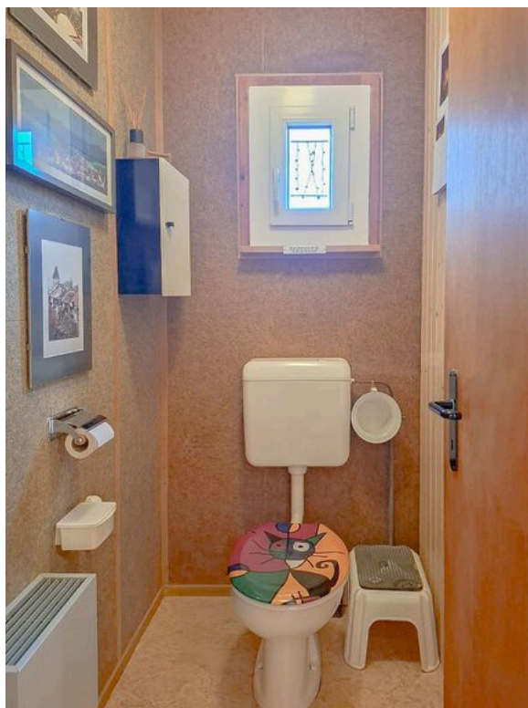
Rez supérieur - WC séparé