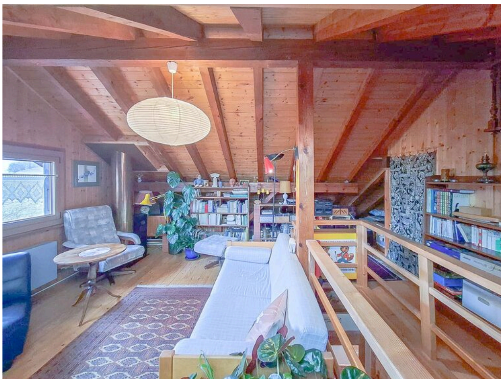
1er étage - spacieuse pièce mansardée avec velux