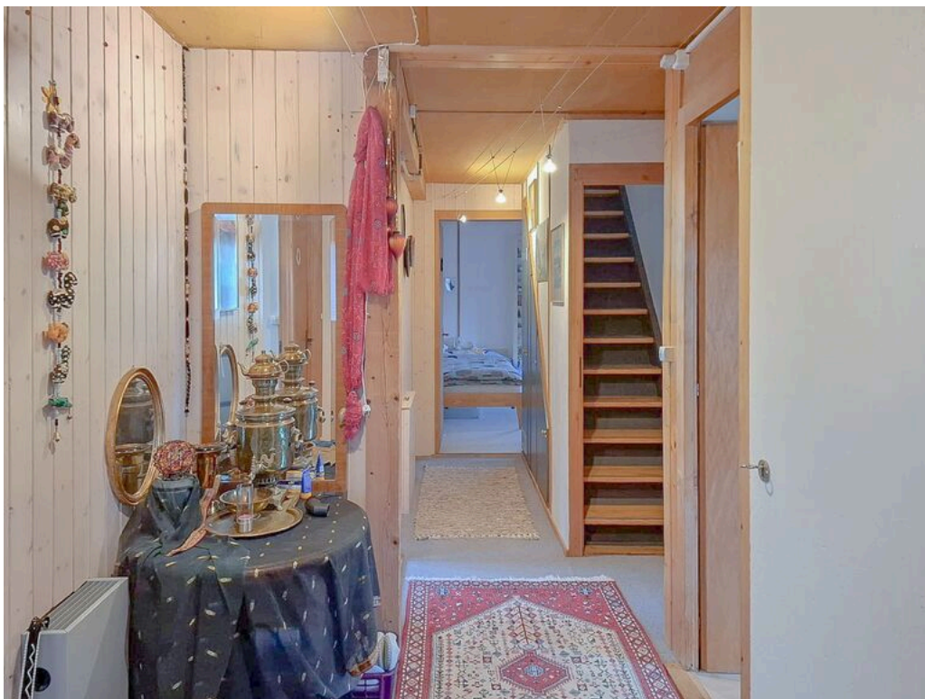
Rez supérieur - hall de distribution