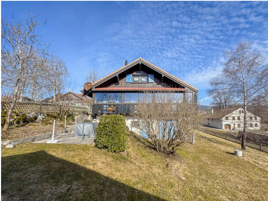
Vue sur le chalet