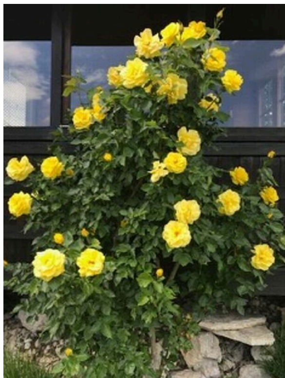
Magnifique rosier dans le jardin