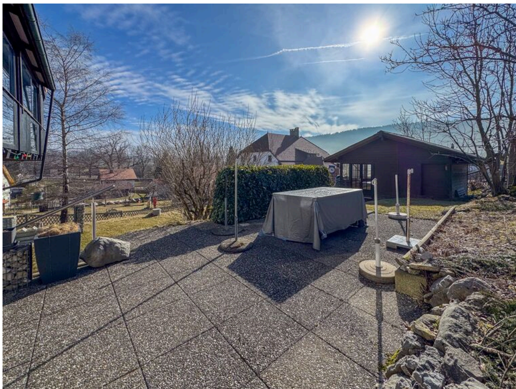
Vue sur la terrasse