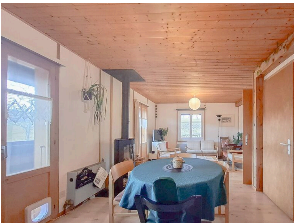
Rez supérieur - salle à manger ouverte sur le séjour