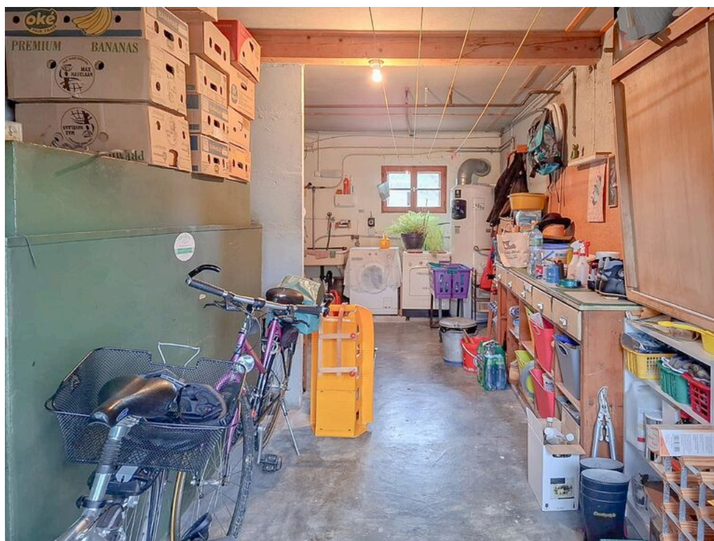
Local technique avec espace de rangement