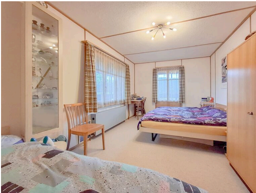
Rez supérieur - chambre 1 avec accès à la véranda