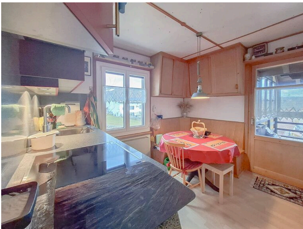
Rez supérieur - cuisine avec accès à la véranda