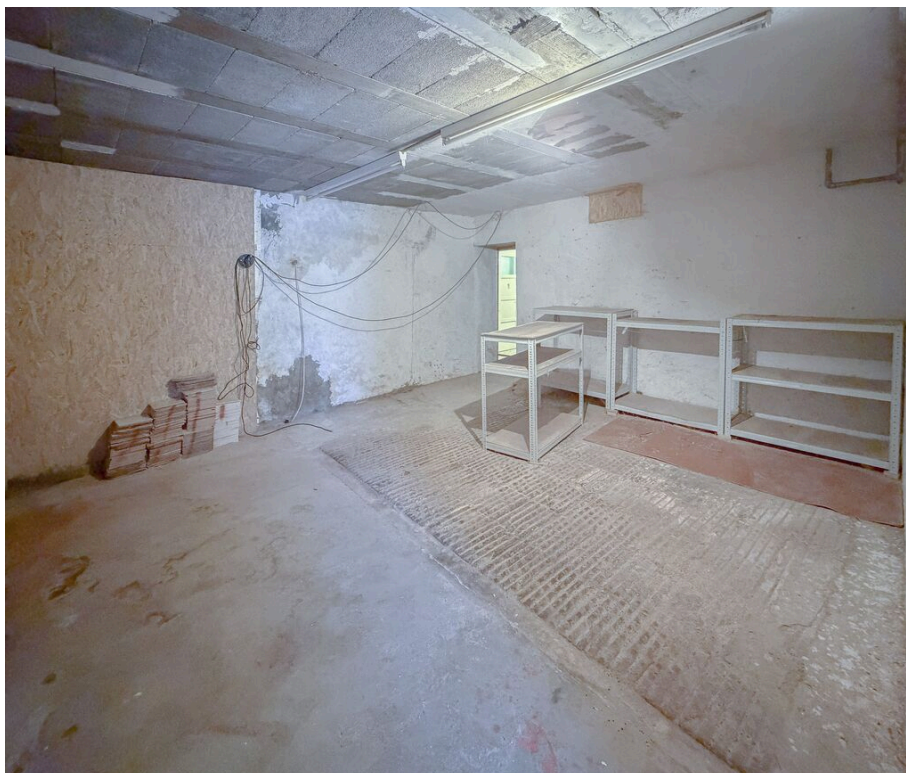
Grande cave no 1