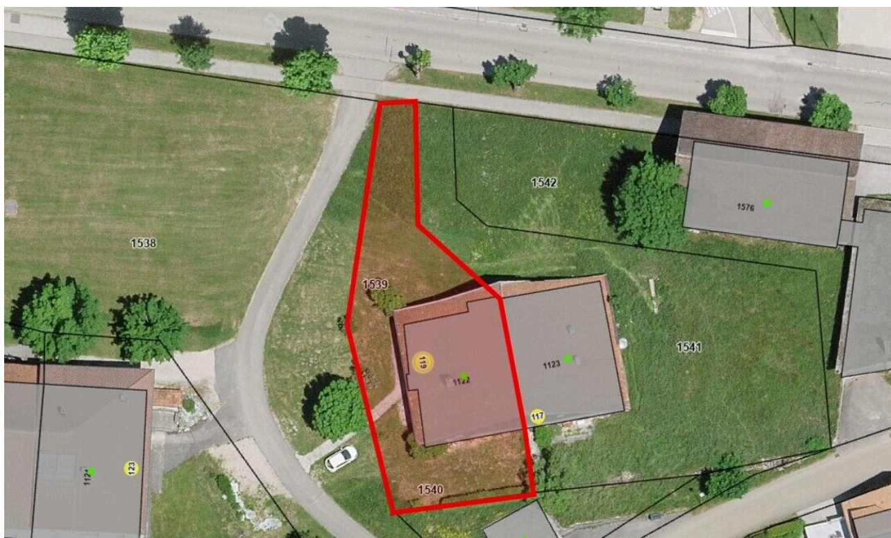
Vue aérienne sur la parcelle