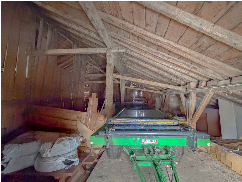
Rural au rez supérieur