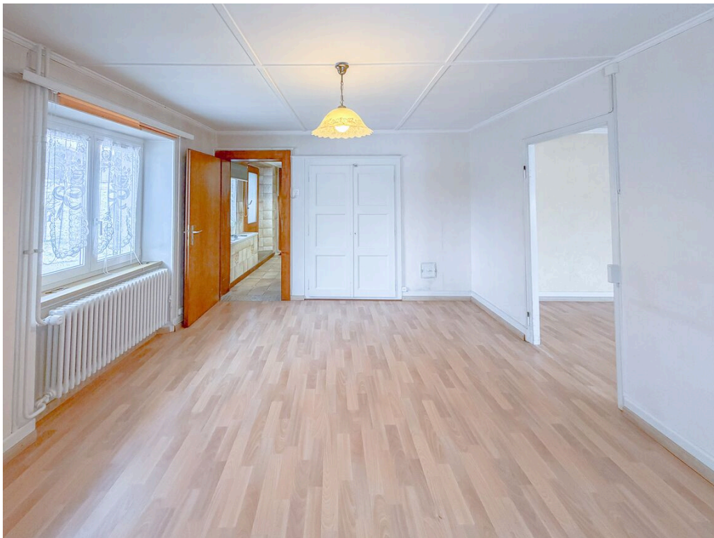
Chambre no 1 Sud-Ouest