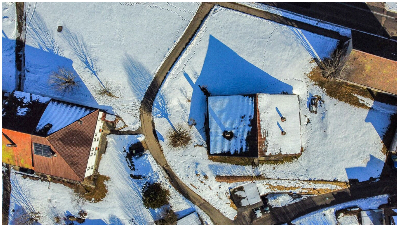
Vue aérienne sur la parcelle