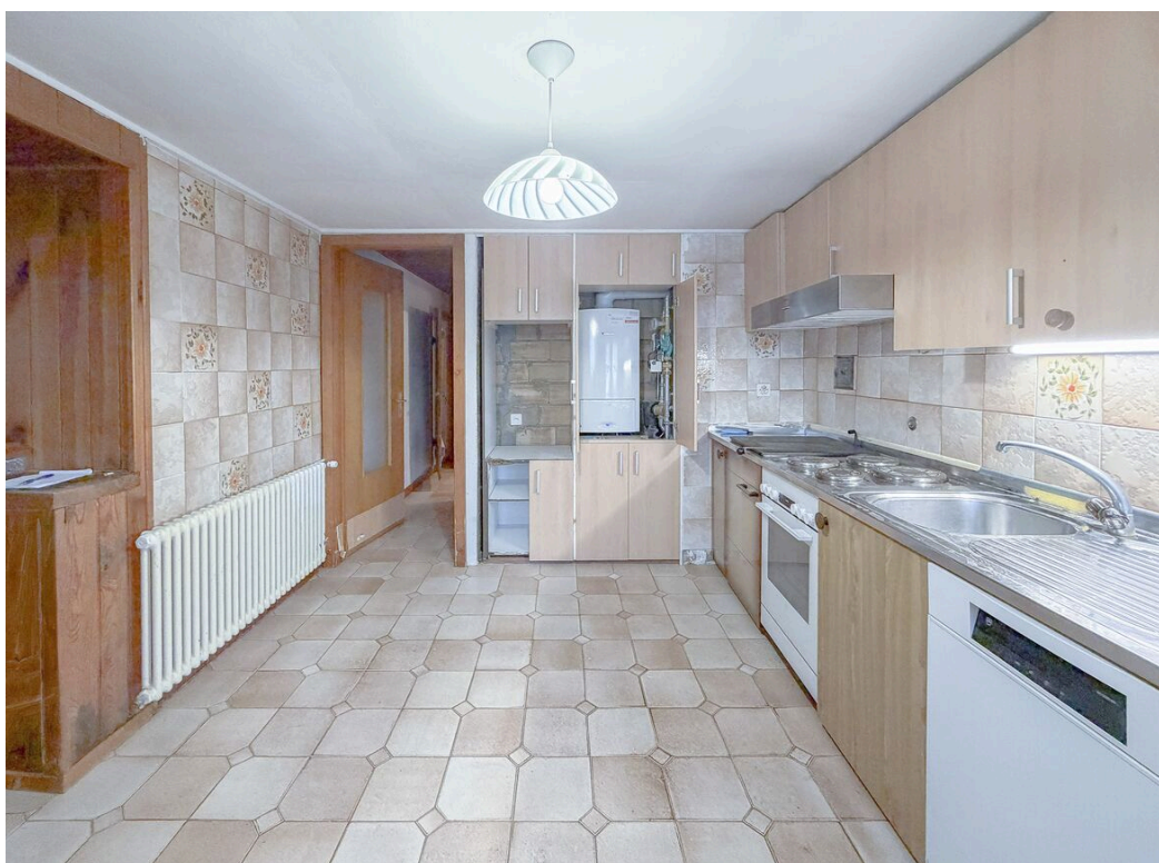
Cuisine avec espace salle à manger