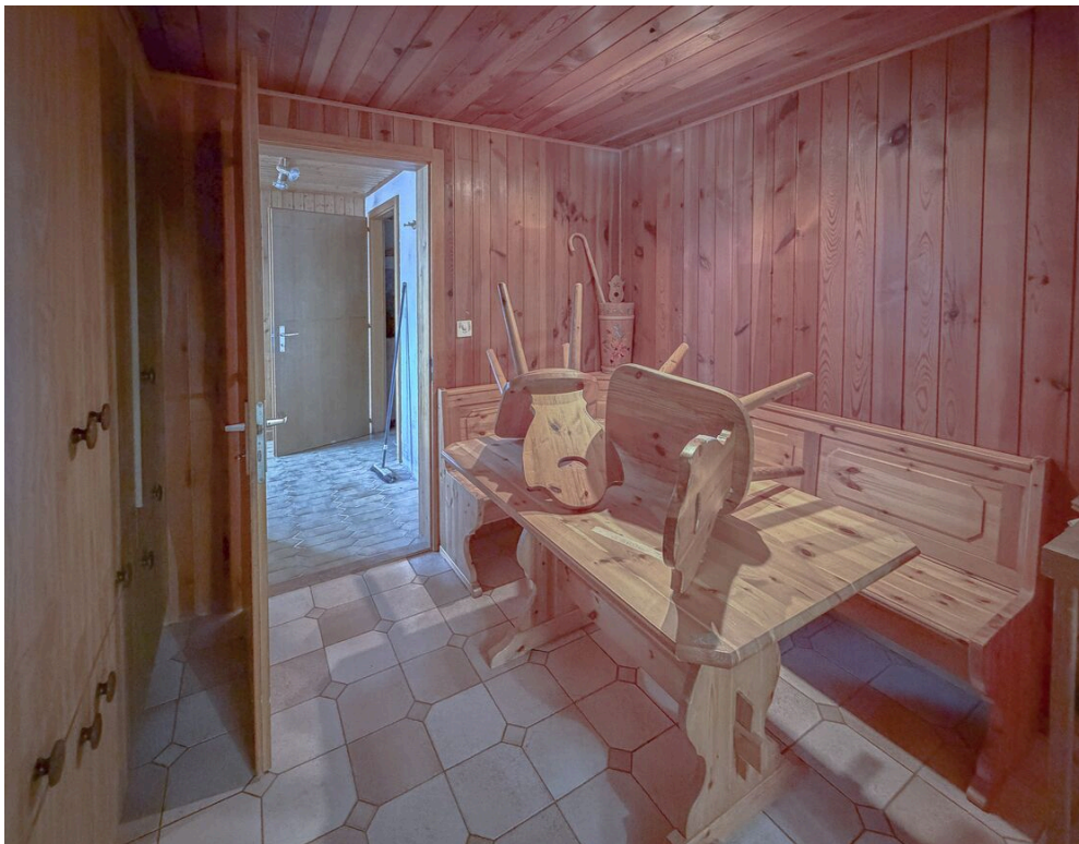
Espace salle à manger