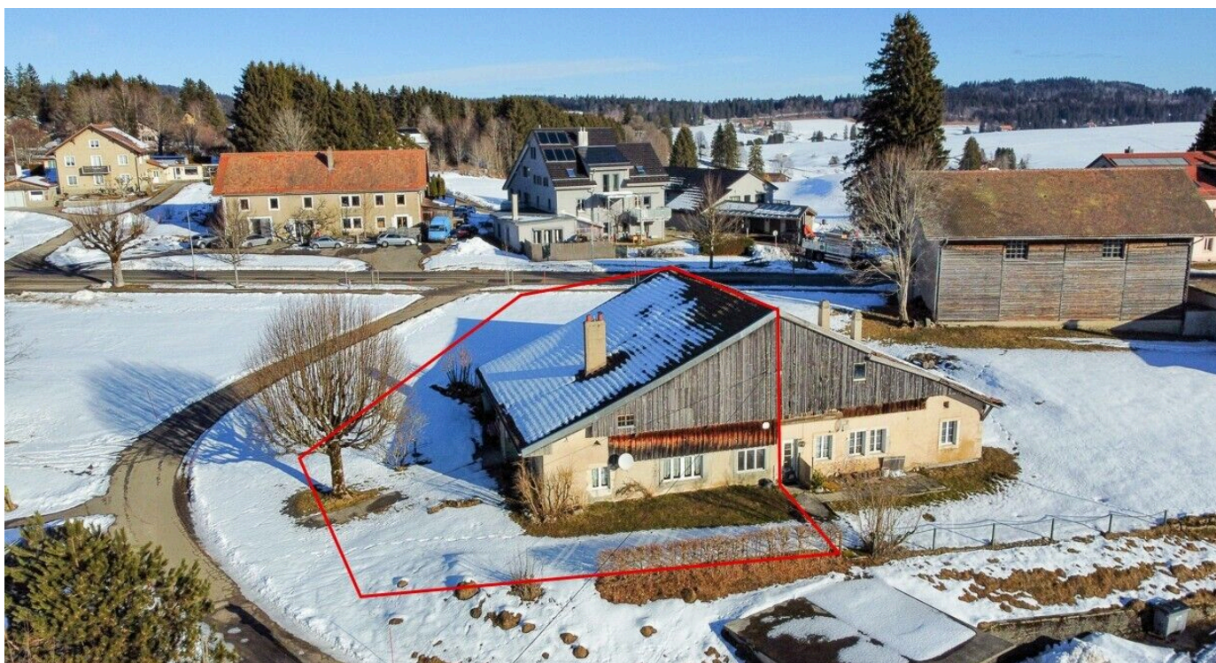
Vue aérienne sur la ferme