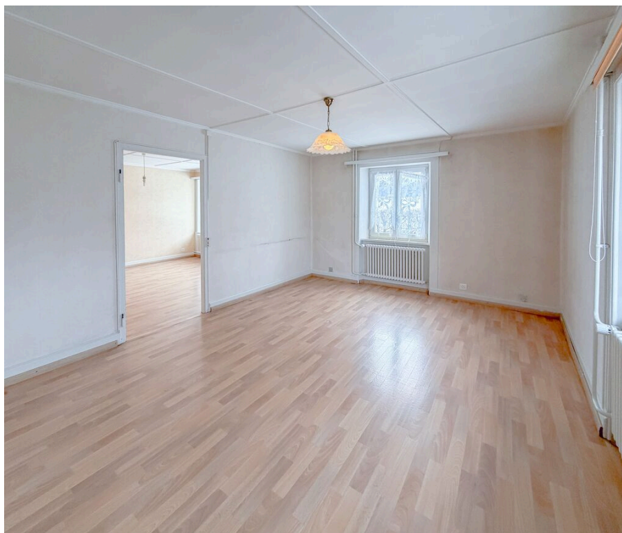
Chambre no 1 Sud-Ouest