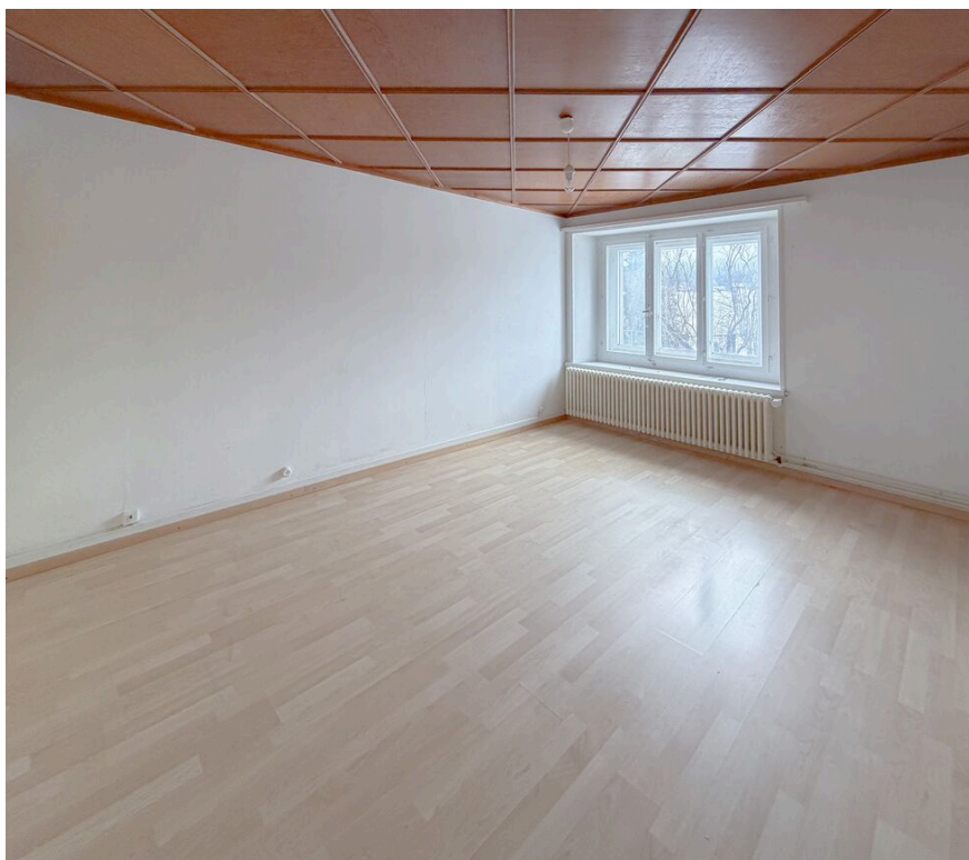
Chambre no 3 Sud-Est