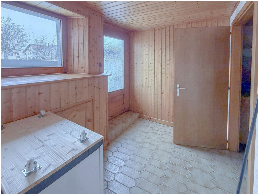
Entrée à l'Ouest