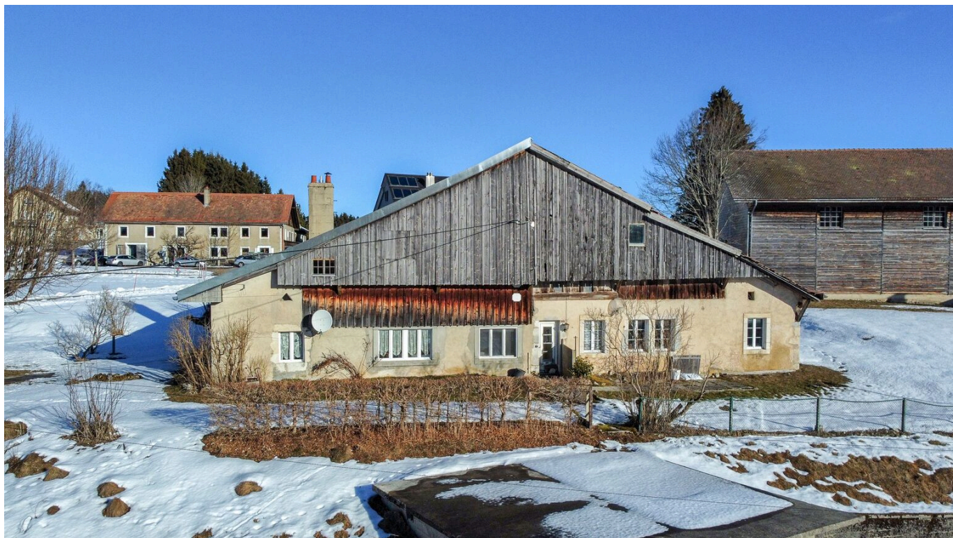
Vue aérienne de la ferme mitoyenne - face Sud