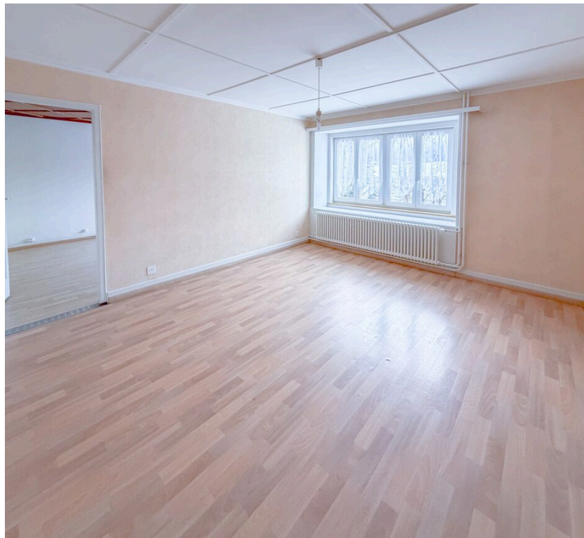
Chambre no 2 Sud