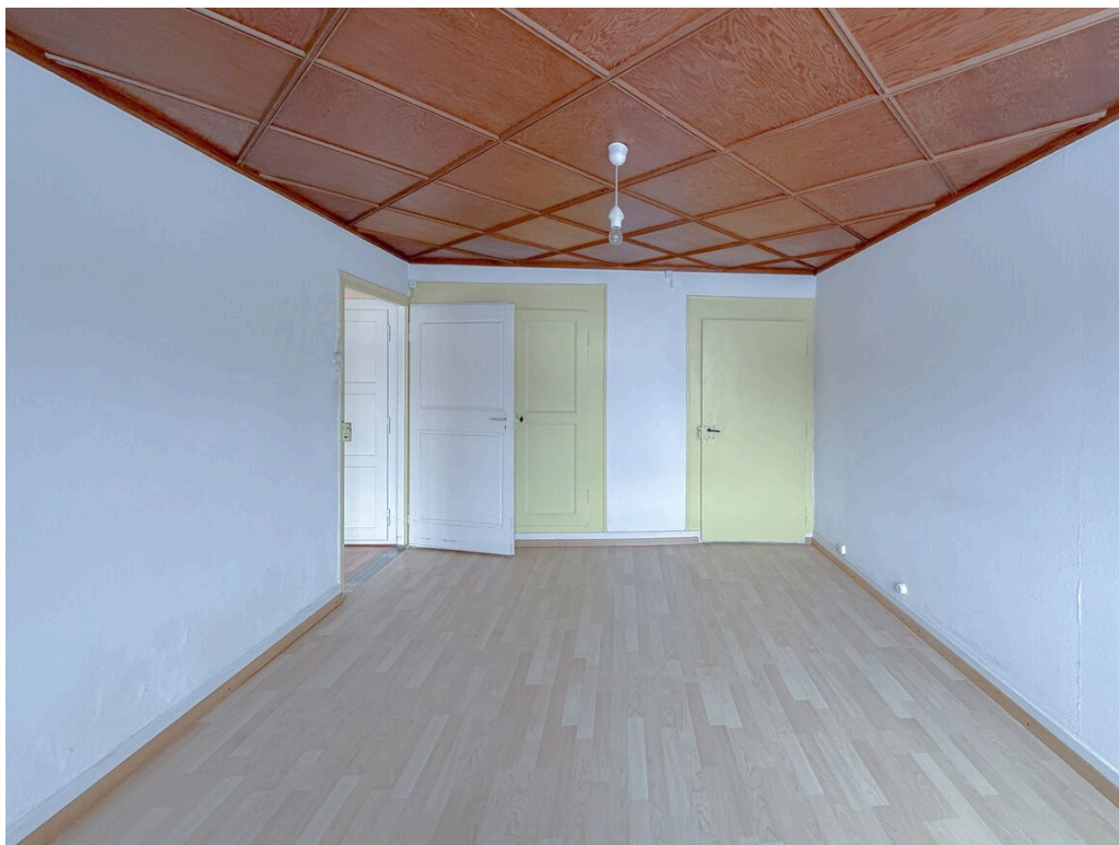
Chambre no 3 Sud-Est

TransCréa Sàrl Immobilier Conseils - Location - Vente