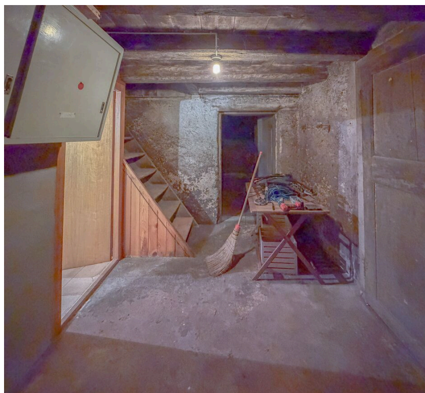
Accès au rural