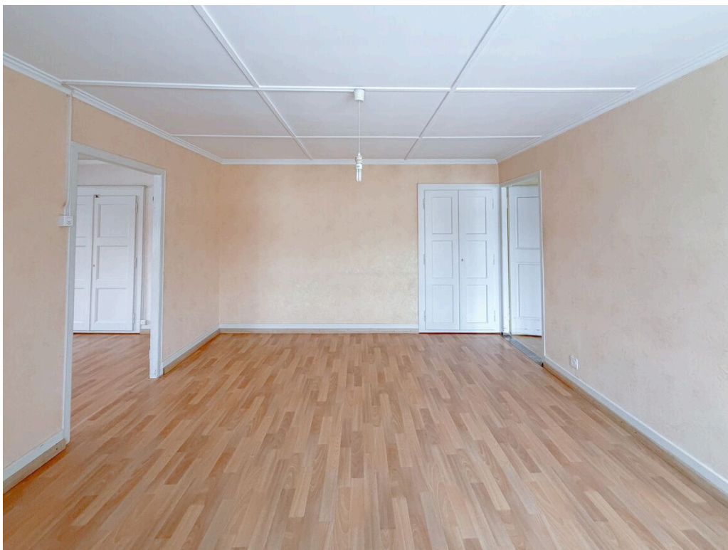
Chambre no 2 Sud

TransCréa Sàrl Immobilier Conseils - Location - Vente