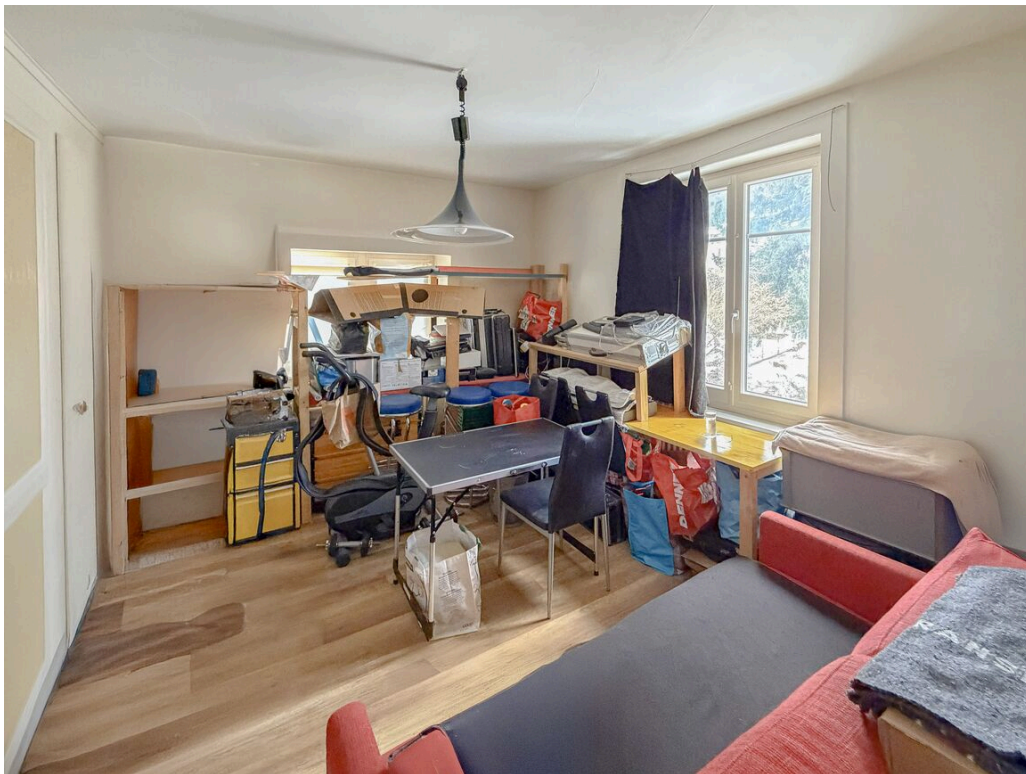
Appartement au 2ème étage - loué