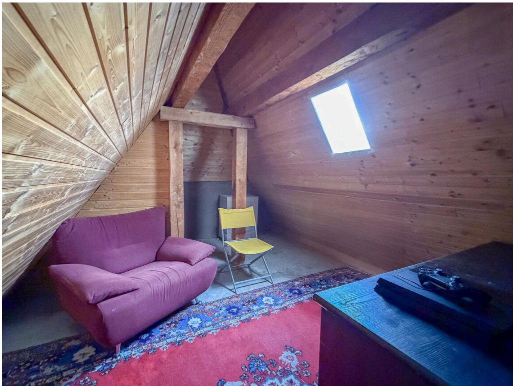
Appartement dans les combles - loué