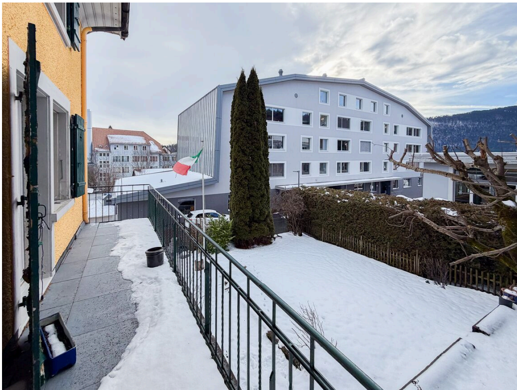
Appartement au 1er étage vacant