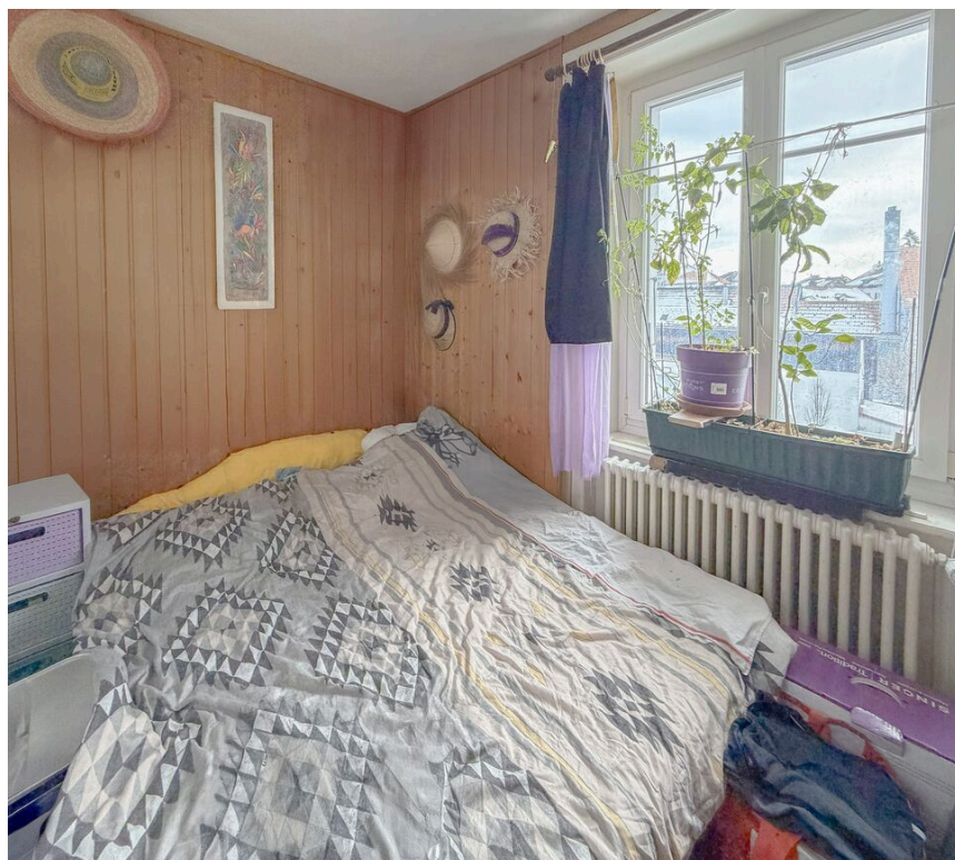
Appartement au 2ème étage - loué