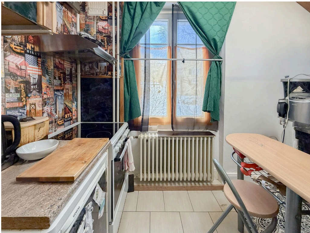
Appartement au 2ème étage - loué