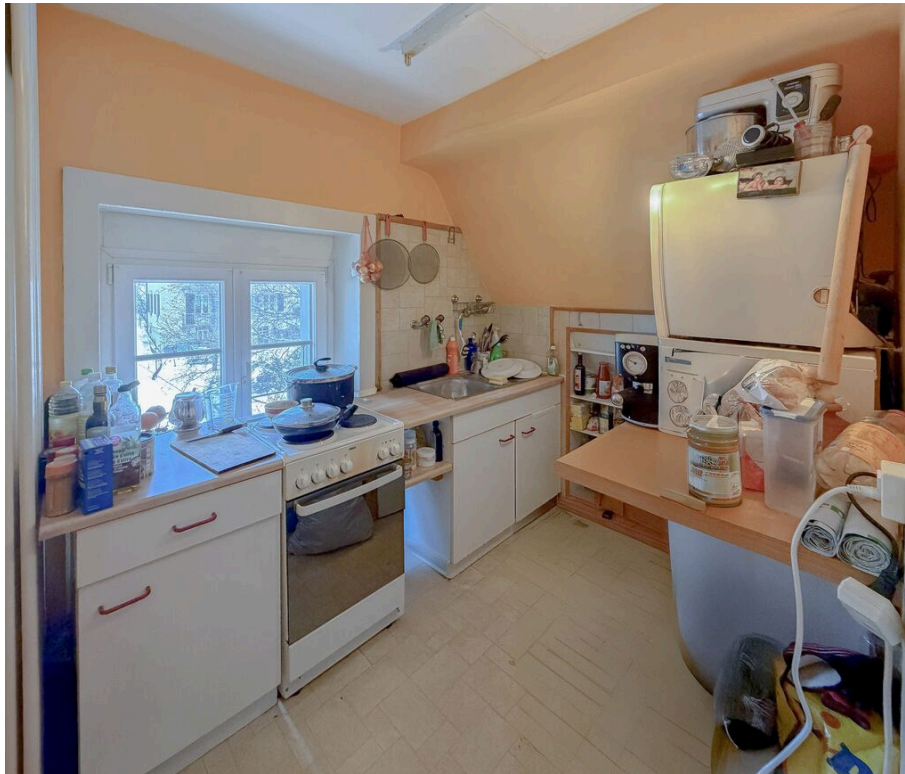
Appartement dans les combles - loué