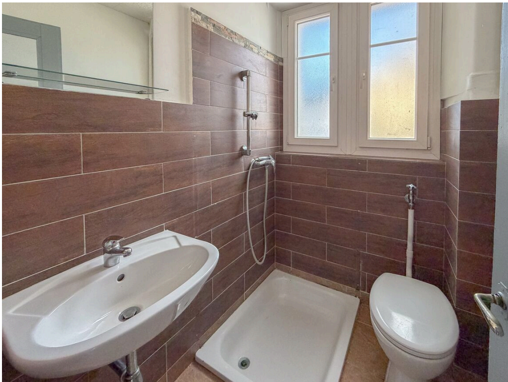
Appartement au 1er étage vacant