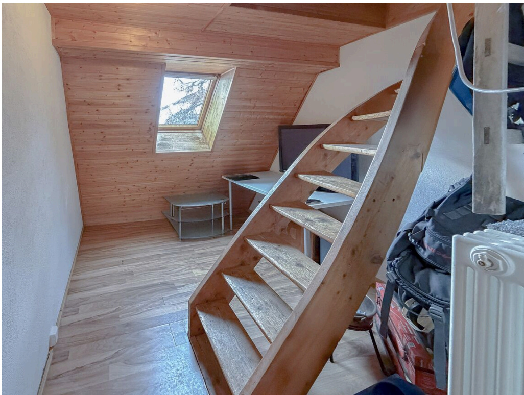
Appartement dans les combles - loué