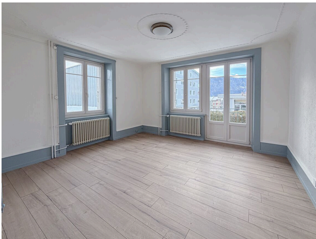
Appartement au 1er étage vacant