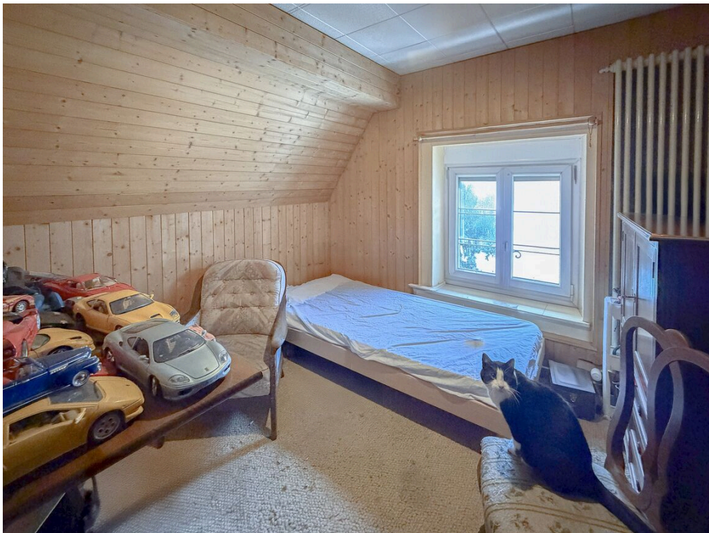
Appartement dans les combles - loué