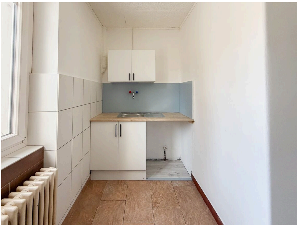
Appartement au 1er étage vacant