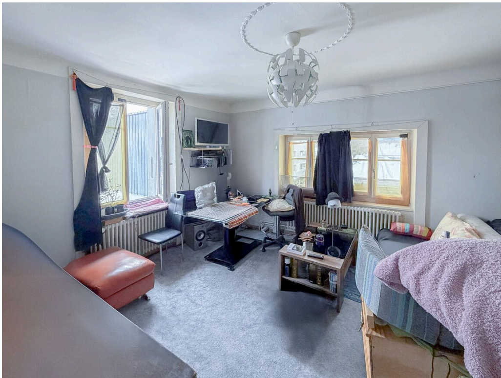
Appartement au 2ème étage - loué