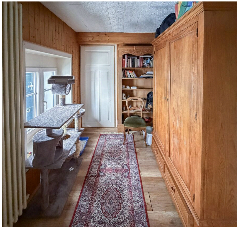
Appartement dans les combles - loué