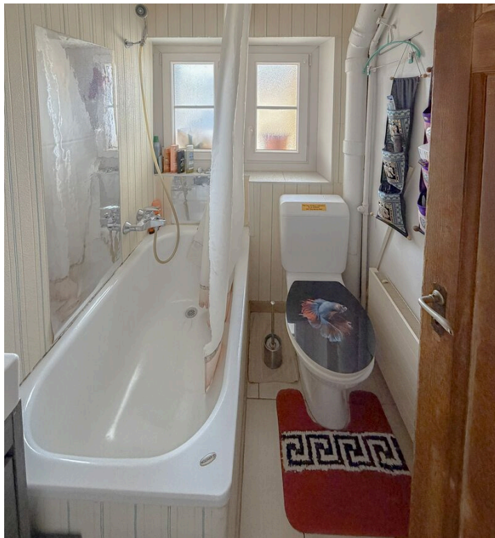
Appartement au 2ème étage - loué