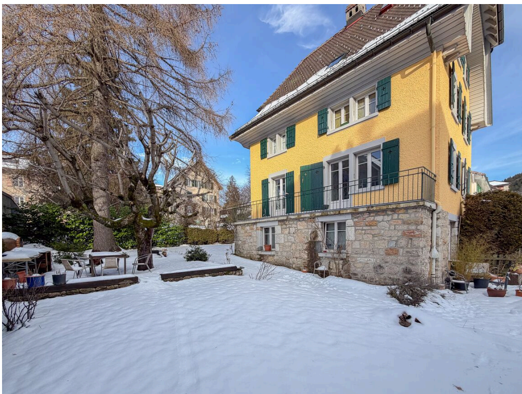
Jardin en commun