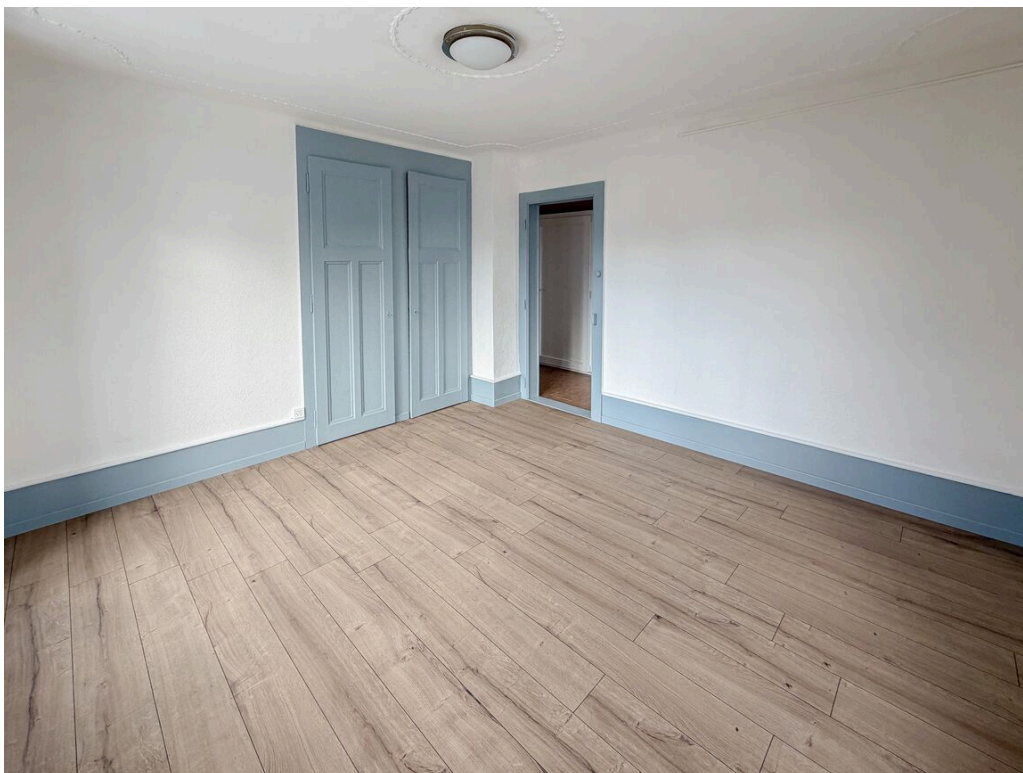
Appartement au 1er étage vacant